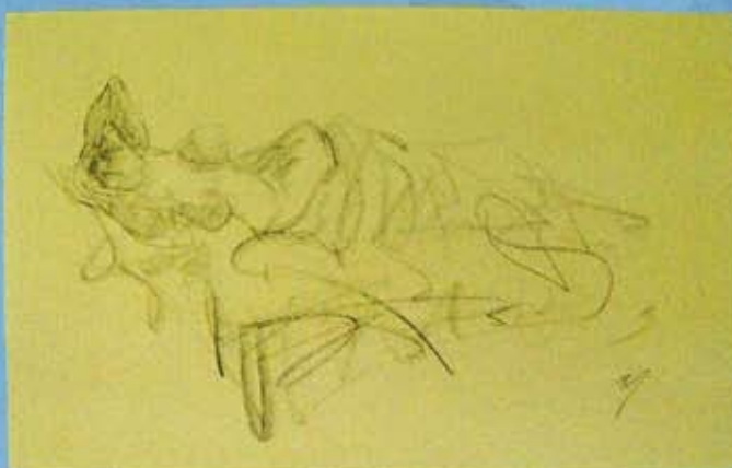
Nerviosa elegancia, 15 x 24 cms, 2008.

1914, donde el Dr. Atl adjunta a sus pinturas un carnet de viaje a través de los paisajes mexicanos y de su técnica de pintura. Apollinaire nos dice: "(El Dr. Atl) Ha visto cosas sencillas, lindas, y las ha apuntado."