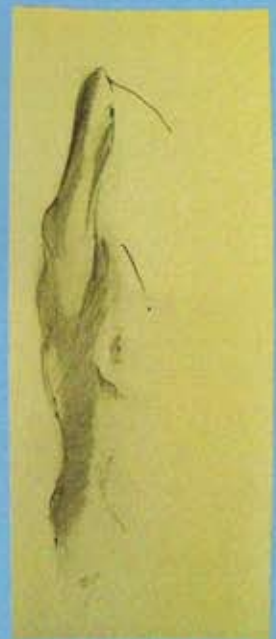
El perfume de tu ser , 27 x 11,5 cms., 2008.