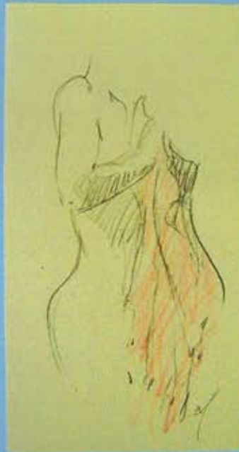
La túnica carmesí , 24 x 13 cms., 2008.