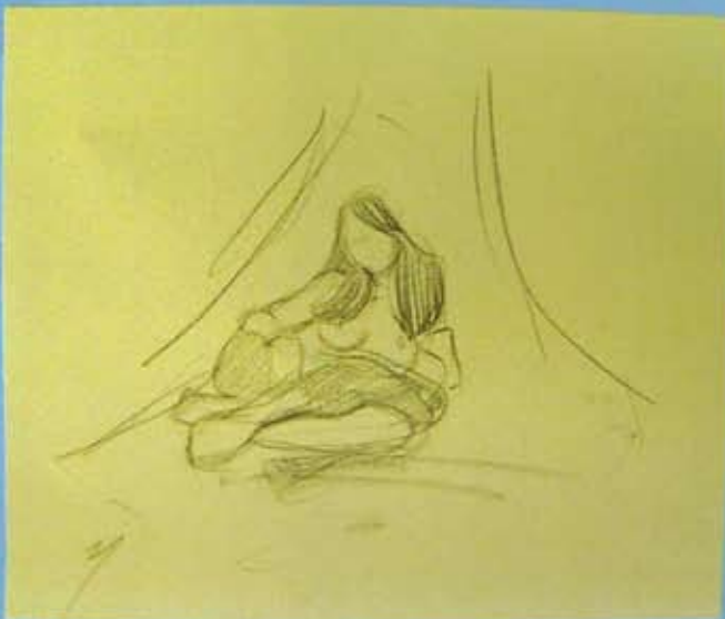
La Femenidad , 16 x 19 cms., 2008.

para que yo con mis manos, sin ayuda episcopal, copiase sobre la blanca tela tu nerviosa elegancia de gacela, y tu gentileza, y tu modo de mirar.