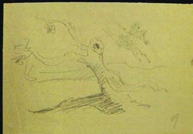
El árbol, 14 x 21.5 cms, 2008.