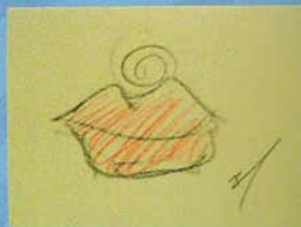
La boca de nopal, 6 x 8 cms, 2008.